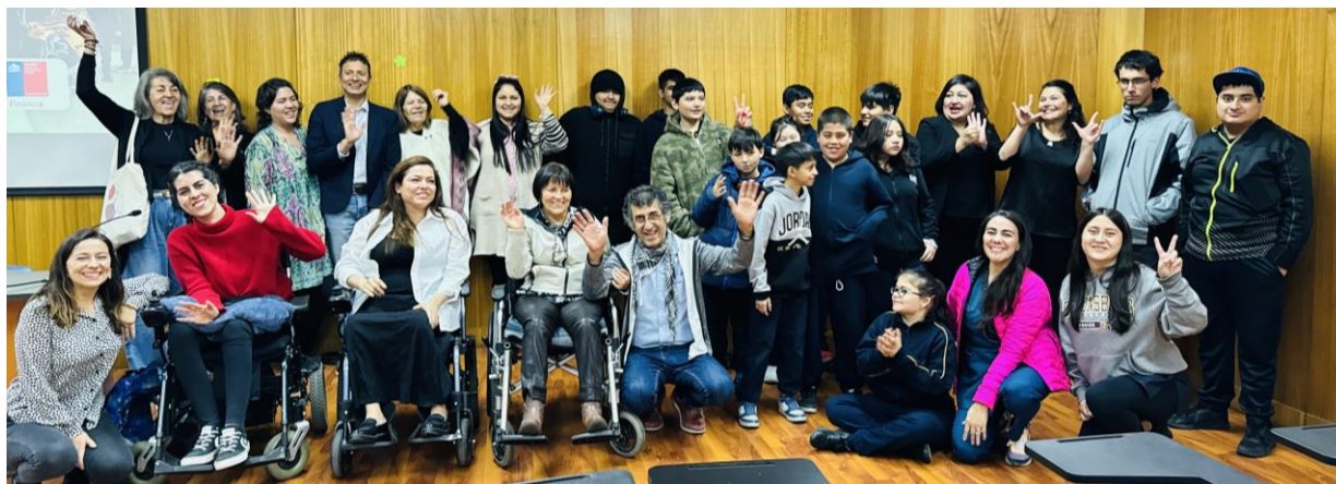
Fotografía del foro realizado en la Universidad Católica Silva Henríquez.