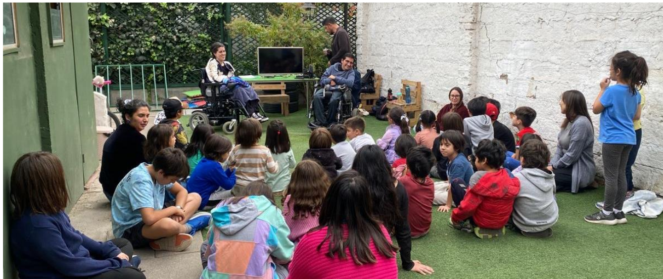
Fotografía de taller realizado en una de las escuelas participantes, Providencia, abril de 2024.