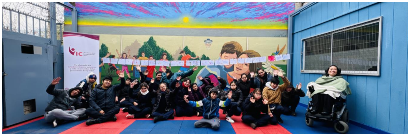
Fotografía de actividad presencial con muro creado de fondo. Junio 2024.