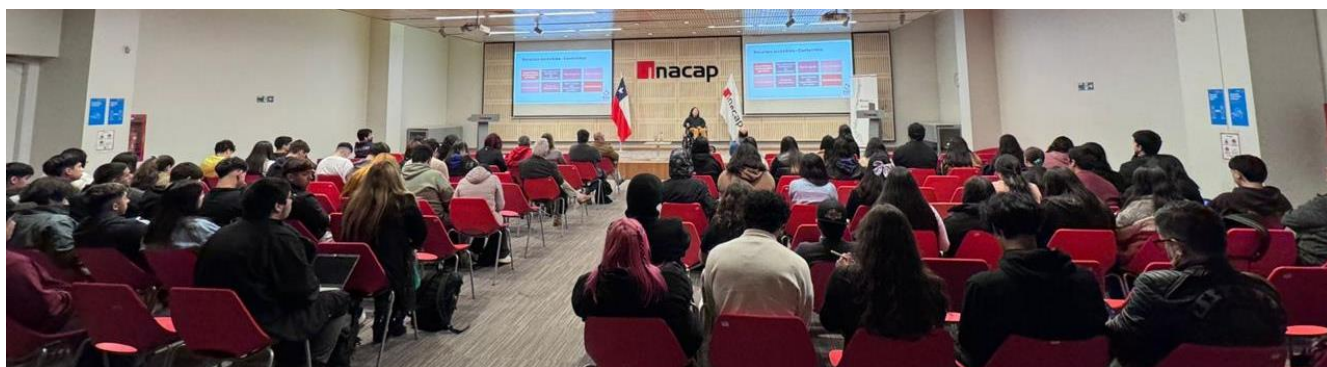
Fotografía de charla realizada en Curicó.