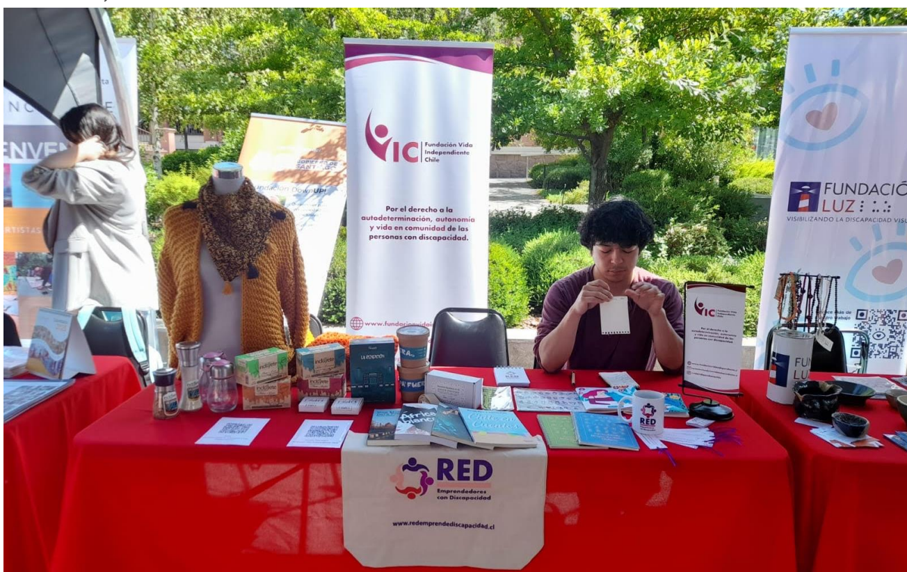
Fotografía del stand RED en el Bazar.